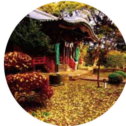
吾妻神社の秋色 (11月中旬)