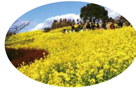
澄んだ空気と満開の菜の花 (1月上旬～2月中旬)