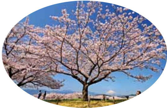
碧い海と公園の春色 (4月上旬)