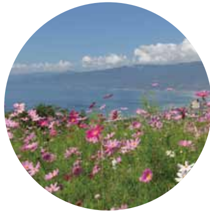
ピンクと碧のコントラスト (8月上旬～中旬)