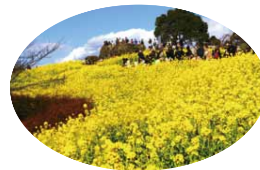
澄んだ空気と満開の菜の花 (1月上旬～2月中旬)