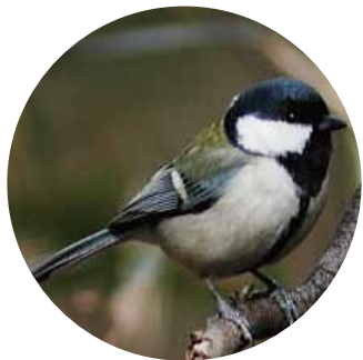
黒いネクタイ シジュウカラ