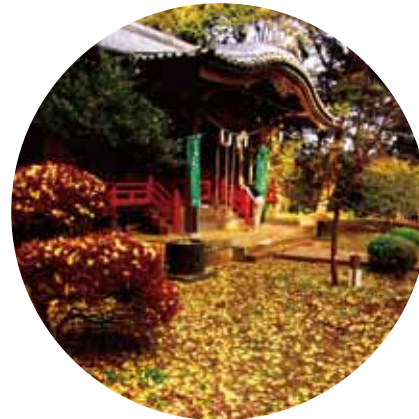
吾妻神社の秋色 (11月中旬)