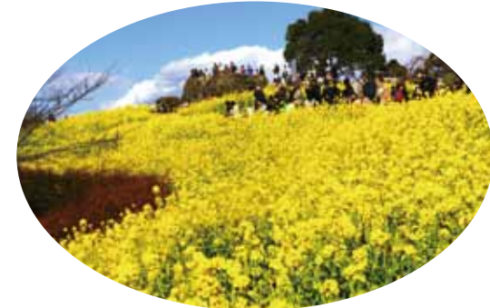
澄んだ空気と満開の菜の花 (1月上旬～2月中旬)