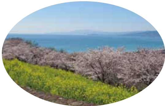
碧い海と公園の春色 (4月上旬)