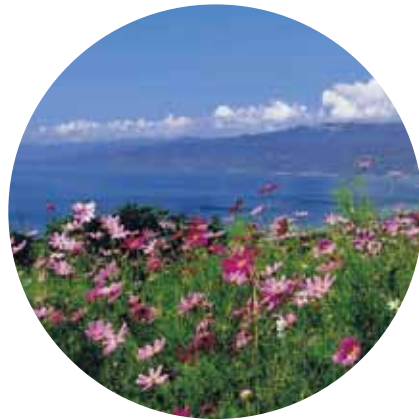
ピンクと碧のコントラスト (8月上旬～中旬)